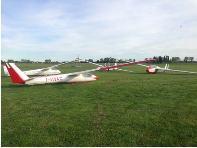
Gli alianti "vintage del raduno