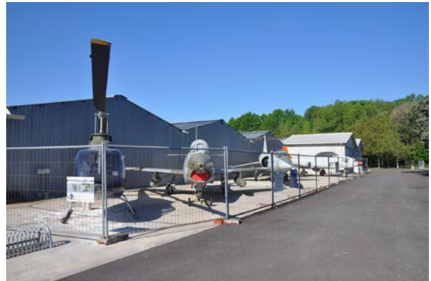
Elicotteri e velivoli in esposizione

L'aeroporto è dotato anche di grandi spazi coperti per l'intrattenimento delle persone e di una confortevole cucina per i soci e gli ospiti del sodalizio.