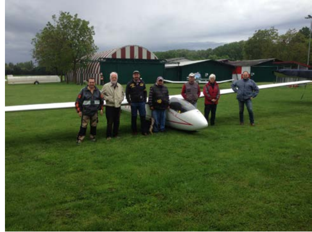
I piloti degli alianti "vintage"