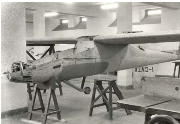
Il CVT-4 Strale in costruzione