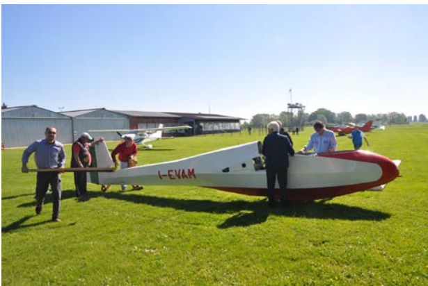
Il Bergfalke in fase di montaggio