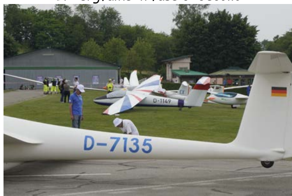
Anoramica dell'area parcheggio