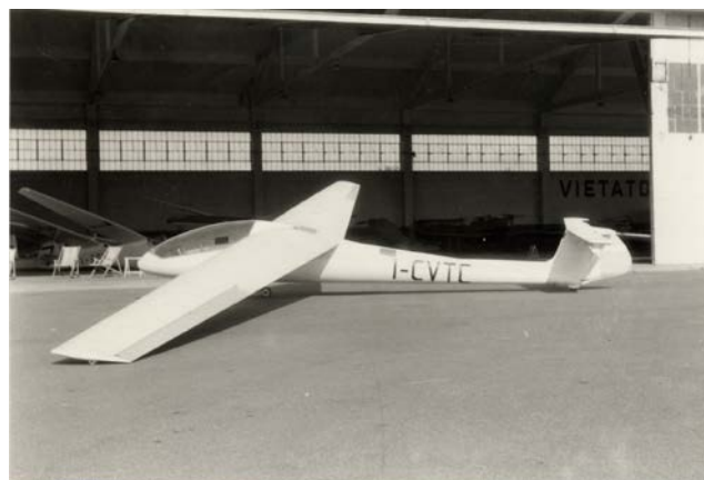
Lo Strale all'Aeritalia di Torino