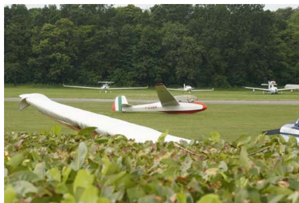
Il Bergfalke appena atterrato