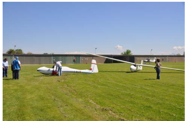
Il Ka-6 è pronto, l'M100S è in preparazione

Si è potuto volare solamente nel tardo pomeriggio di sabato ed in totale sono stati effettuati 3 voli con il biposto Bergfalke ed uno ciascuno con i due monoposto.