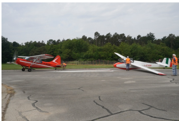
Il Bergfalke in fase di decollo