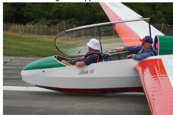
L'aliante ASK-13 in preparazione per il decollo