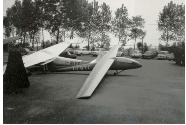
Lo Strale sull'aeroporto di corso Marche di Torino