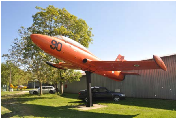
Il Velivolo MB-326 in bella mostra