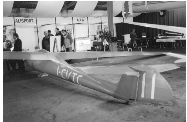
Lo Strale esposto alla Mostra Mercato di Valbrembo