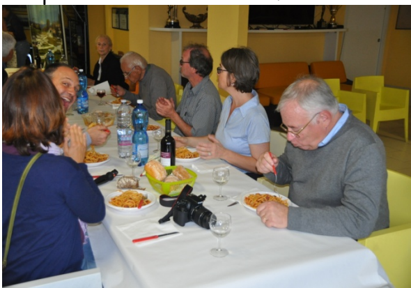
Amatriciana per tutti