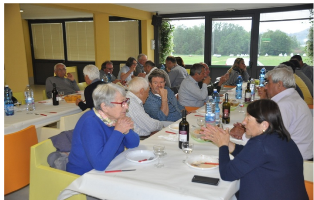
Panoramica dei 25 partecipanti alla serata