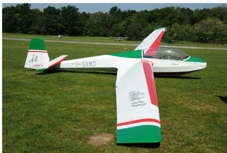
L'aliante Ka-13 sull'aeroporto di Alzate Brianza