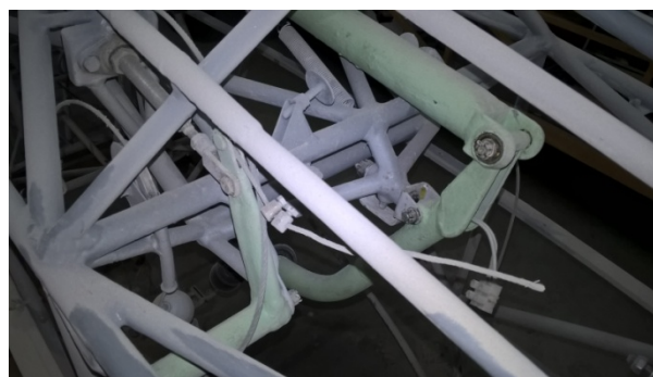
Un dettaglio della catenaria dei comandi di volo