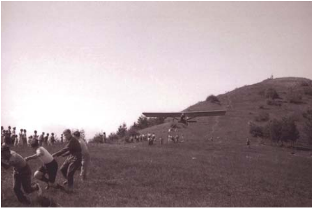
Foto sopra: l'aliante Varese mentre si stacca dalla vetta del Campo dei Fiori trainato da un gruppo di volovelisti.