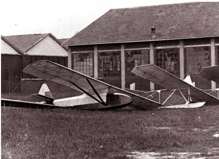
Foto a fianco: l'aliante Varese. In secondo piano uno Zoegling ed i capannoni della Caproni