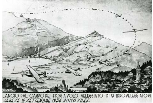
Disegno sopra: cartolina commemorativa del lancio dei nove alianti dal Campo dei Fiori di Varese