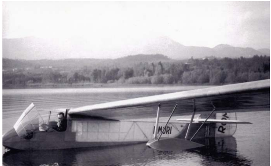
Foto a fianco: l'aliante Roma sul lago di Varese dove normalmente ammarava dopo il lancio dal Campo dei Fiori