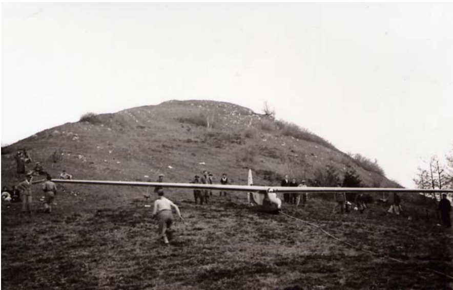
Foto a fianco: l'aliante Roma pronto al lancio dalla vetta del Campo dei Fiori